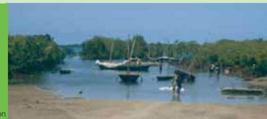
Le Parc national de Quirimbas, Mozambique.

toutefois pas facile : les responsabilités sont fragmentées et les intérêts en jeu très divers. Pourtant, depuis quelque temps, on voit fleurir des petits complexes touristiques fondés sur des principes durables et écologiques.