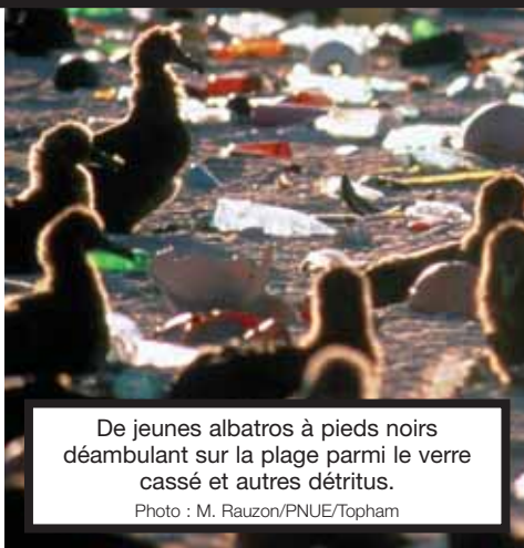
De jeunes albatros à pieds noirs déambulant sur la plage parmi le verre cassé et autres débris.

Mais les grands coupables sont en réalité les voitures et autres véhicules terrestres : l'huile de moteur usagée et l'eau chargée d'hydrocarbures qui s'écoulent des routes sont responsables de la plus grande partie de