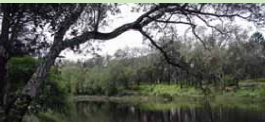
Mata de Sesimbra, Portugal.

Ce projet de 1,2 milliard de dollars pourrait bien servir de modèle mondial en matière de tourisme et de développement durable. Utilisant des matériaux de construction